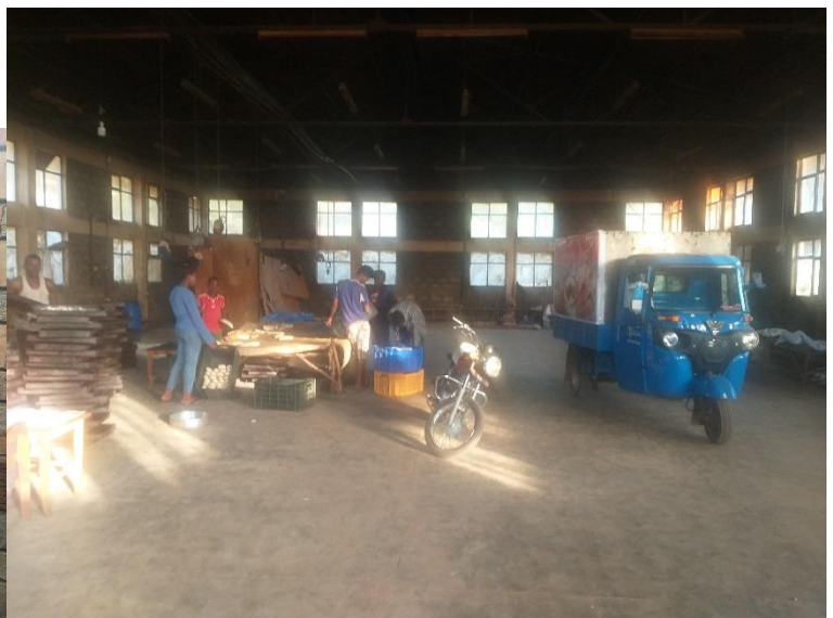
Minitaxi mit offener Ladefläche (Verkaufsstelle) - das neue Minitaxi im Einsatz (Lebensmittelwerkstatt Emmanuel)