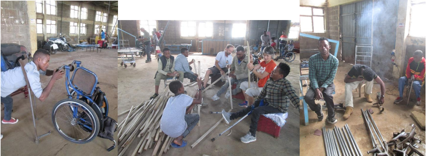
Hilfsmittelproduktion: Rollstühle – Oberarmgehstöcke «Amerikaner» aus Holz - Metallkrücken

In der Hilfsmittelwerkstatt ist seit dem Besuch im Oktober einiges geschehen: der Vorratsraum wurde frisch gestrichen, aufgeräumt, elektrische Leitungen in der Werkstatt geflickt, die behinderten Männer arbeiten zurzeit daran, einen grösseren «Vorrat» an Hilfsmitteln herzustellen: 500 Paar Krücken, 20 Rollstühle, einige Twikes (three wheel bicycles= handpedal-betriebene Fahrräder) sind gefragt. Eine grosse Bestellung ist aus Kambatta, einer Stadt in der Region, eingegangen: unzählige mittellose Behinderte wurden registriert, welche entweder Krücken oder Rollstühle benötigen, um «auf die Beine zu kommen» - diese jedoch nicht selbst bezahlen können. Der Unterstützungsfonds (BENEVOL FUNDS) von Verein Emmanuel Schweiz ermöglicht es, den mittellosen Behinderten die dringend benötigten Hilfsmittel zu schenken. Ihre Freude und Dankbarkeit sind riesig 😊!