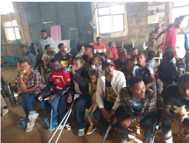
Mitglieder von «Projekt Emmanuel» -

Nicht zuletzt haben mir meine behinderten Freunde in Soddo ausdrücklich aufgetragen, euch allen ganz herzliche Grüsse zu überbringen und Danke zu sagen, für all euer Mittragen, eure Gaben und Gebete. Sie sind für unzählige Behinderte in Äthiopien eine grosse Ermutigung, lebensverändernde Hilfe und schenken Behinderten neue Lebensperspektiven ☺!